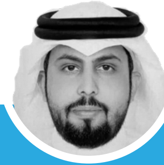
المشرف المالي - عضو مجلس إدارة عضو لجنة الأوقاف أنايف منيتان احييان المخلفي